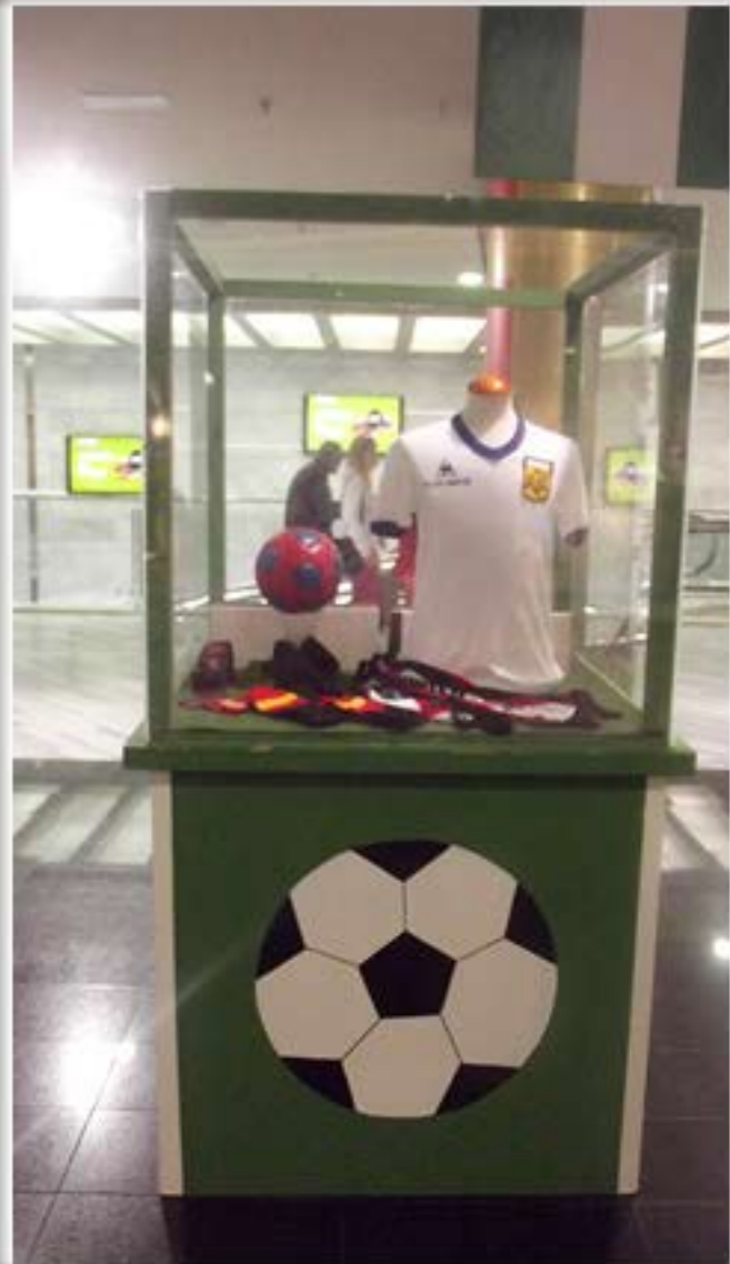
BALÓN FIRMADO POR MARADONA, SCHUTER, QUINI, ZUBIZARRETA, ETC.